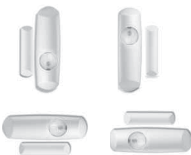
Figure 2: Multiple Unit Connection Procedure